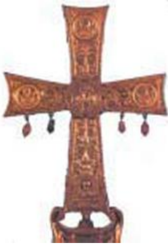
Ο σταυρός ήταν σύμβολο της θρησκείας και του κράτους (Μουσείο Βατικανού)