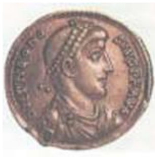
Ο Θεοδόσιος Α σε νόμισμα της εποχής. (Νομισματικό Μουσείο Αθηνών)